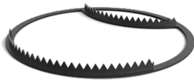
Подставка под шампура