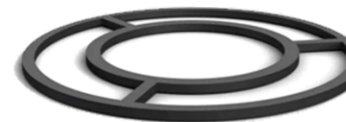
Переходник для казана