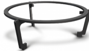
Подставка под казан