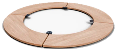
Стол-обод из фанеры