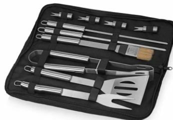
Набор для гриля